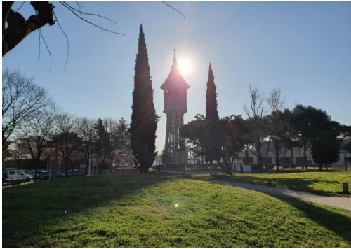
← Torre de l'aigua