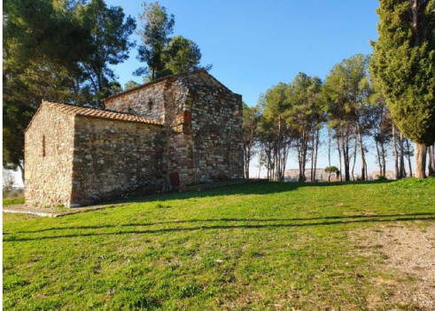
← Capella de Sant Nicolau