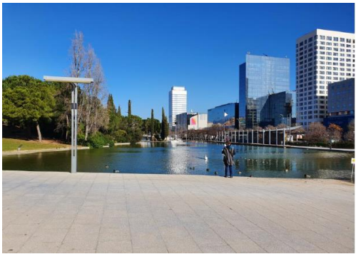
← Parc de Catalunya