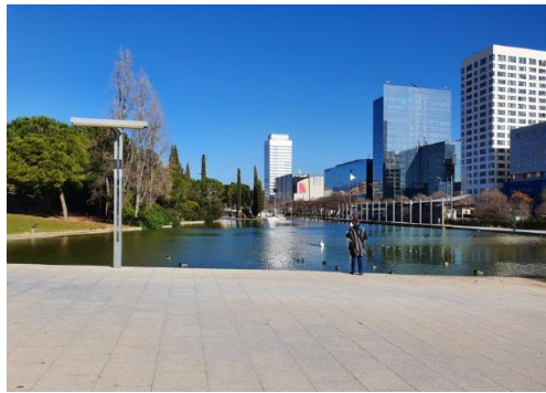
← Parc de Catalunya