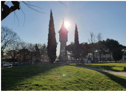
← Torre de l'aigua