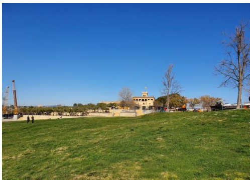
← Can Gam bús