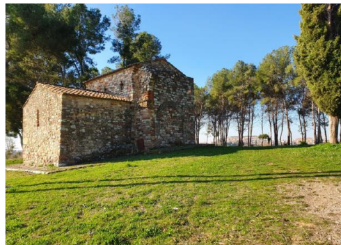
← Capella de Sant Nicolau