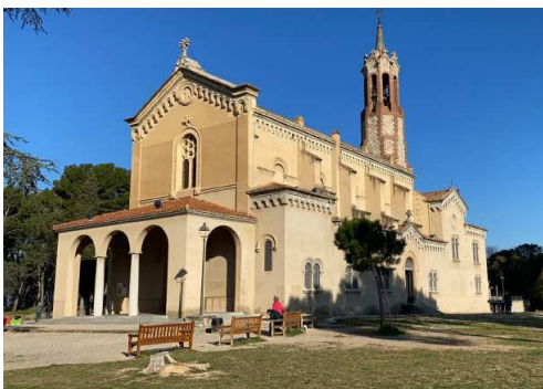
← La Salut