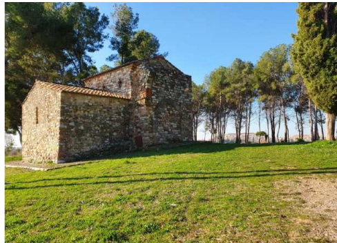
← Capella de Sant Nicolau