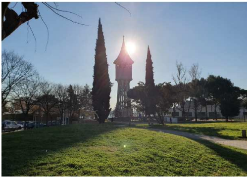
← Torre de l'aigua